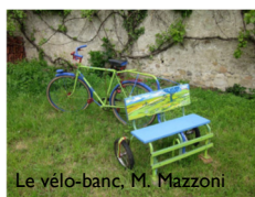
Le vélo-banc, M. Mazzoni

Pour fabriquer notre banc, nous avons cherché sur Internet des idées et nous avons trouvé plein de bancs originaux.